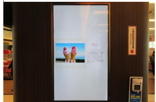
タブロイド誌「せとうちグルメ通信」（イメージ）