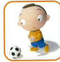
スポーツ・レクリエーション施設 (補助あり)