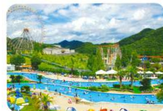
姫路 セントラルパーク