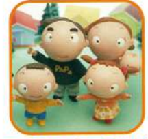
その他生活関連 (補助なし)