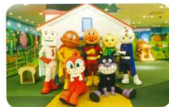
神戸アンパンマン こどもミュージアム&モール