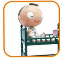
ホテル・旅館等 (補助あり)