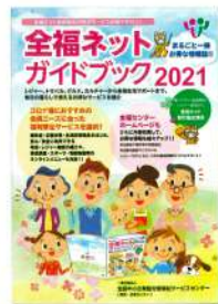
ファミリーパックガイドブック (全国版・年1回発行・20名に1冊)