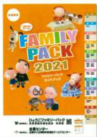
ファミリーパックガイドブック (兵庫県版・年1回発行1名に1冊)