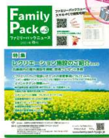
会報誌ファミリーパックニュース (奇数月・年4回発行)