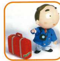
旅行代理店 (補助あり)